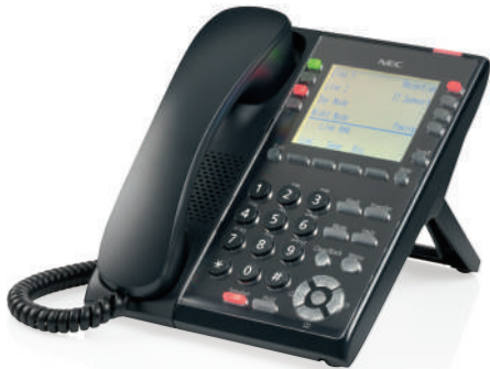
SL2100 IP 話機